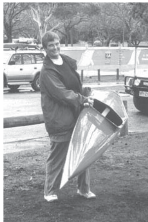
Struer Touring Boats stillede en tracer til rådighed.

Jeg tog af sted nogle dage før WGM for at nå at vænne mig til tidsforskellen. Desuden skulle jeg også have hentet ”min” kajak i lufthavnen.