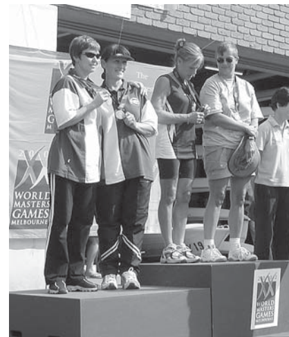
Vi får vores velfortjente guldmedaljer.