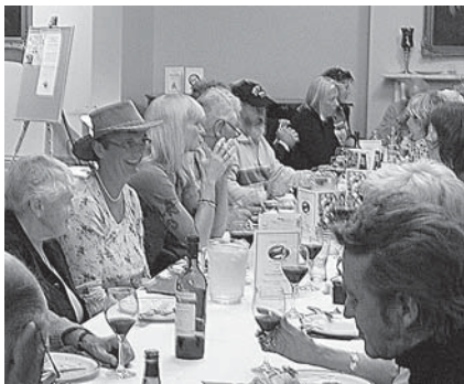
Den Danske Klub i Melbourne inviterede til australsk middag.

Sandhedens time, det første løb Konkurrencedag 1 oprandt. Det var K1-løbet. Afhængig af alder skulle der ros forskellige distancer fra 7-24 km. Min aldersgruppe skulle ro 19 km. De enkelte startgrupper blev sendt af sted med meget korte intervaller, men det fungerede fint. Det skyldtes især måden det skete på. Man fik først lov til at gå på vandet når man blev kaldt op. Herefter havde man lidt tid inden gruppen blev kaldt frem til en bøje. Fra denne bøje og op til selve startlinjen, der lå 300 m længere fremme, skulle vi ro på linje og vi SKULLE ro på linje. Det betød, at når vi nåede startlinjen kunne vi sendes af sted med det samme og uden tyvstart. Selve løbet var hårdt. Da der var kort mellem starterne indhentede de hurtigere hurtigt de foranstartende, og man følte at man roede opad hele tiden. Det gjorde det heller ikke nemmere at vi kun måtte hænge på dem i vores