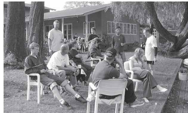
Hjælperne venter på de sidste, mens andre gør klar til søndagens løb.