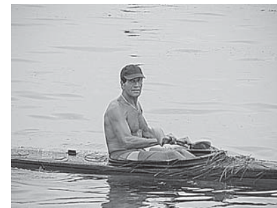
Michell havde ikke bedste tid, men måske lidt mindre tangpå fordækket ville hjælpe.